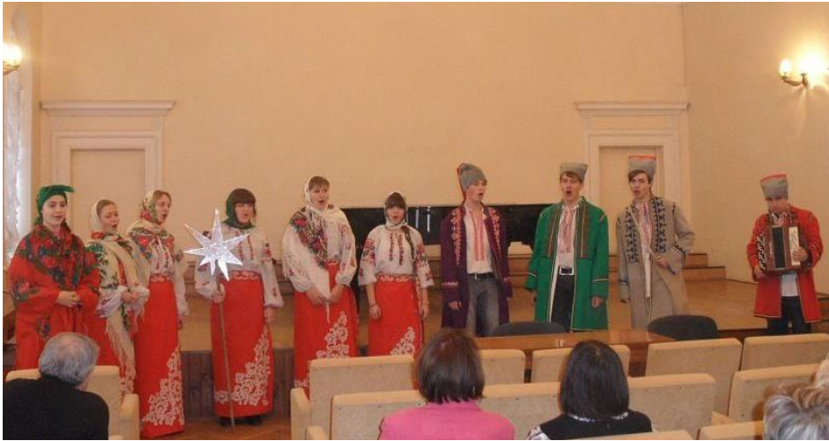
Творча самодіяльність студентів 3 курсу відділу хорового диригування Чернігівського фахового музичного голеджу ім. Л. Ревуцького (2009 р.)