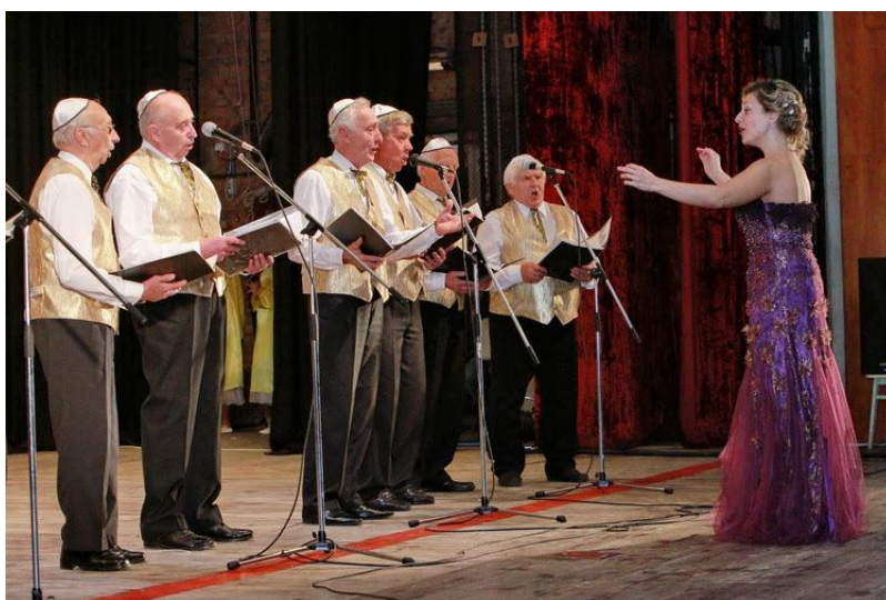
Хор «Goldene Menor» (2012 р.)