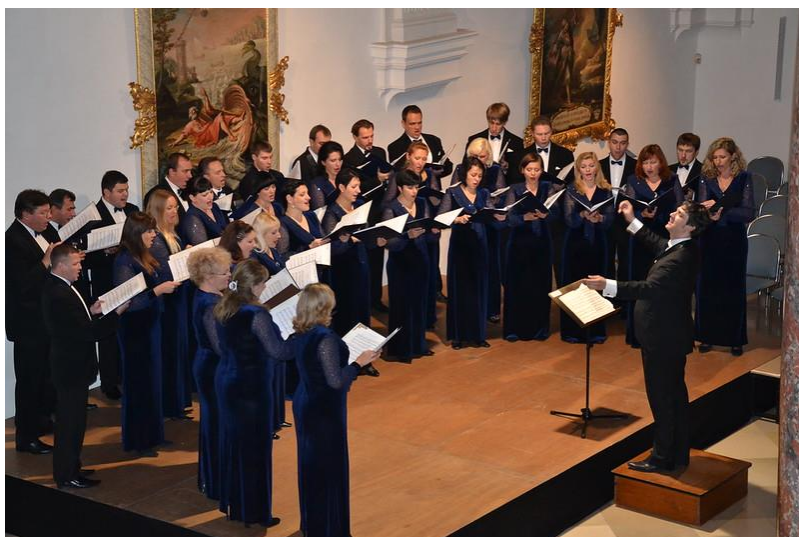
Камерний хор ім. Д. Бортнянського (2019 р.)