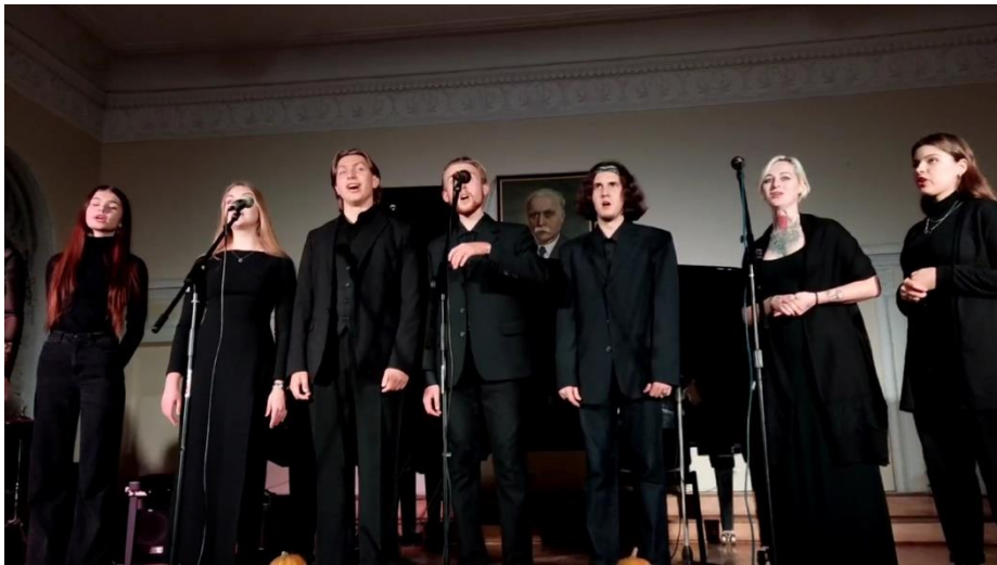
Хор «Діти Магури» Чернігівського фахового музичного голеджу ім. Л. Ревуцького (2022 р.)