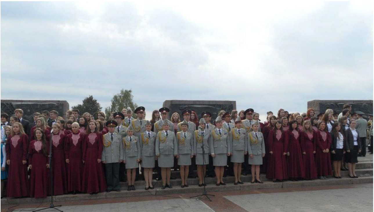
Зведений хор студентів Чернігівського фахового музичного голеджу ім. Л. Ревуцького та капела бандуристів ім. Остапа Вересая (2011 р.)