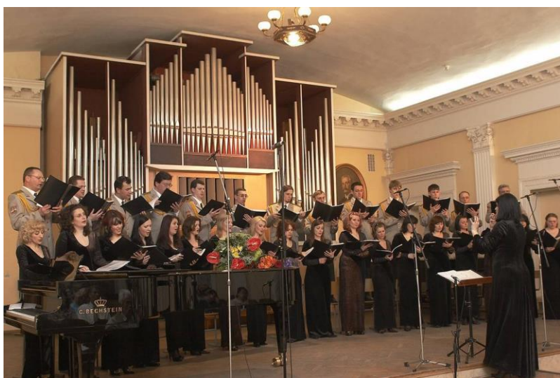
Хор ВМЦ (2010 р.)