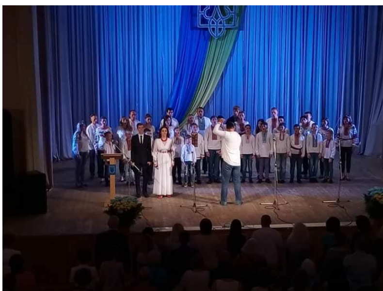
Концертний хор хлопчиків Камерного хору ім. Д. Бортнянського (2019 р.)